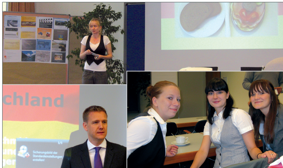
Eindrücke von der ersten studentischen Konferenz des Baltic College in Potsdam.