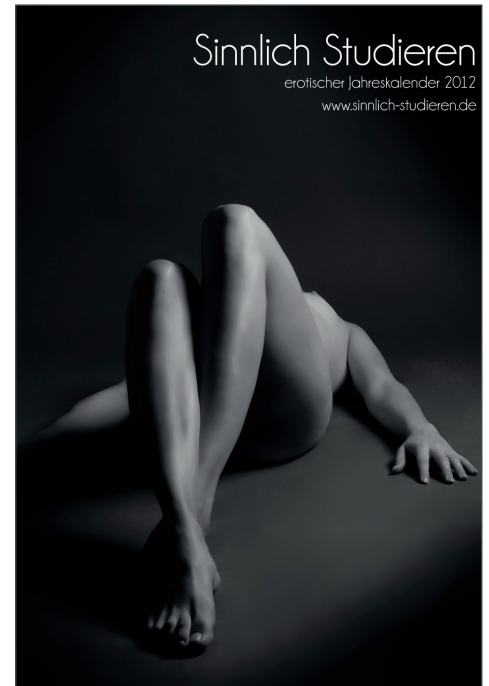
Das Titelblatt des studentischen Kalenders „Sinnlich Studieren“.

Weitere Informationen sowie Bestellung unter www.sinnlich-studieren.de .