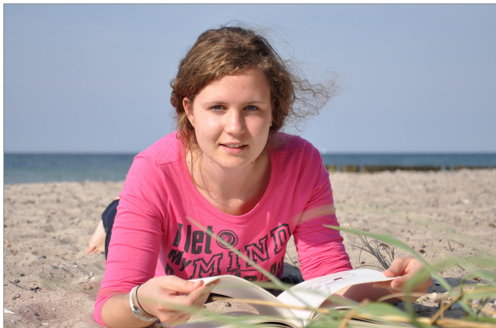
Zwei Abschlüsse in drei Jahren: Das BC Schwerin wird mit zeitlicher Verkürzung der Kombination Studium plus IHK-Ausbildung noch deutlich interessanter für die Studieninteressierte.