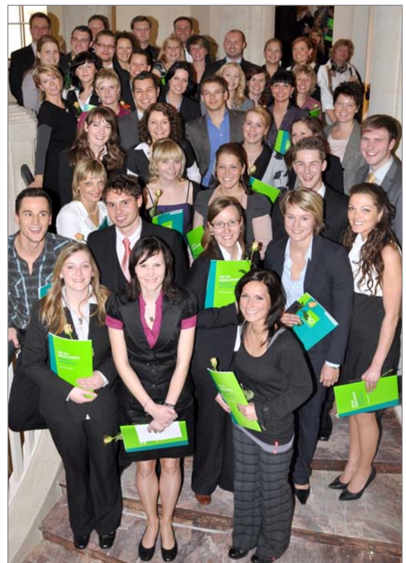
Zeugnisübergabe im Schloss Schwerin: Die Absolventen des Bachelor-Studiengangs „Hotel- und Tourismusmanagement“.