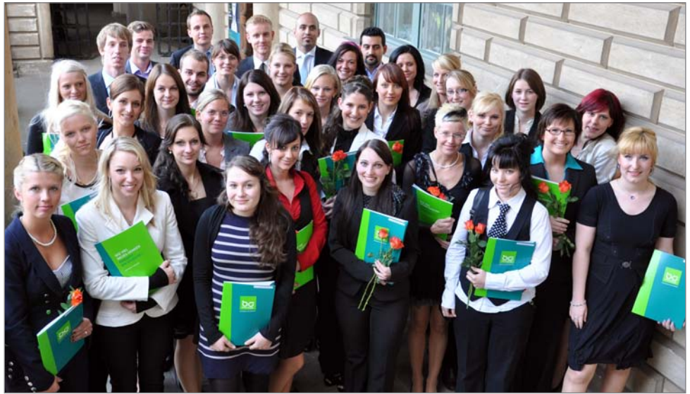
Zeugnisübergabe im Schloss Güstrow: Die Absolventen der Bachelor-Studiengänge „Unternehmensmanagement“ und „Management im Gesundheitstourismus“ nach der Feierstunde.